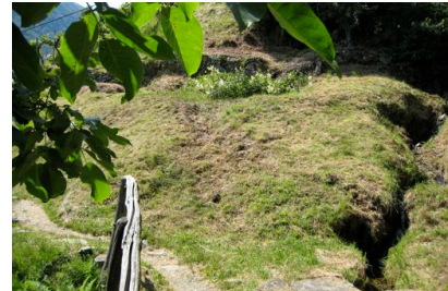
Bild: ehemaliger Standort des Hanfbrunnens.

Sanierung und landschaftliche Aufwertung des Hanfbrunnens. Ausarbeitung einer Dokumentation zur Nutzung von Hanf.